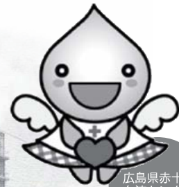
広島県赤十字 血液センター マスコット ちーびっと